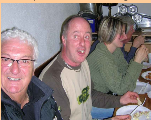
La bonne humeur